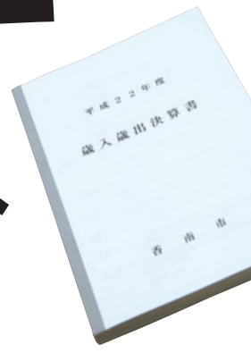
▲409ページからなる市の決算書