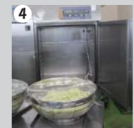
4 すばやくラップし、次の作業に移る。