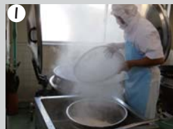
1 ゆでた野菜を釜から取り出す。