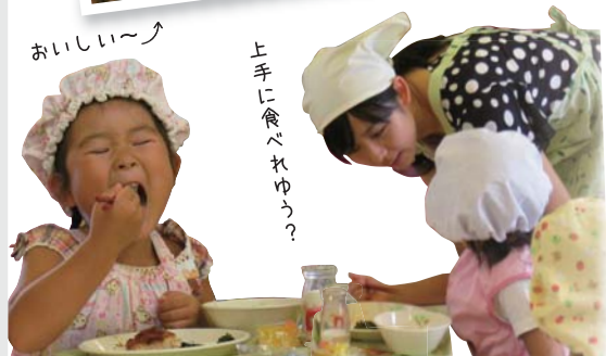
おいしい〜 上手に食べれよう?