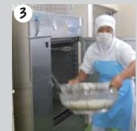
3 真空冷却機から野菜を取り出す。