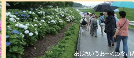
あじさいうおーくの参加者