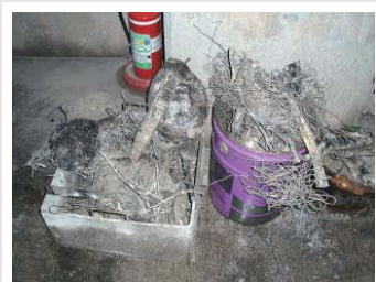
▲これは、燃えるゴミ袋に入っていた針金などの違反ゴミです。

生ゴミ・汚れた紙くず・少量の草木・紙オムツ・たばこの吸い殻などを入る袋です。(紙オムツは汚物を取りのぞいてください)決して、金属類や陶器類、ガラスなどは入れないでください。