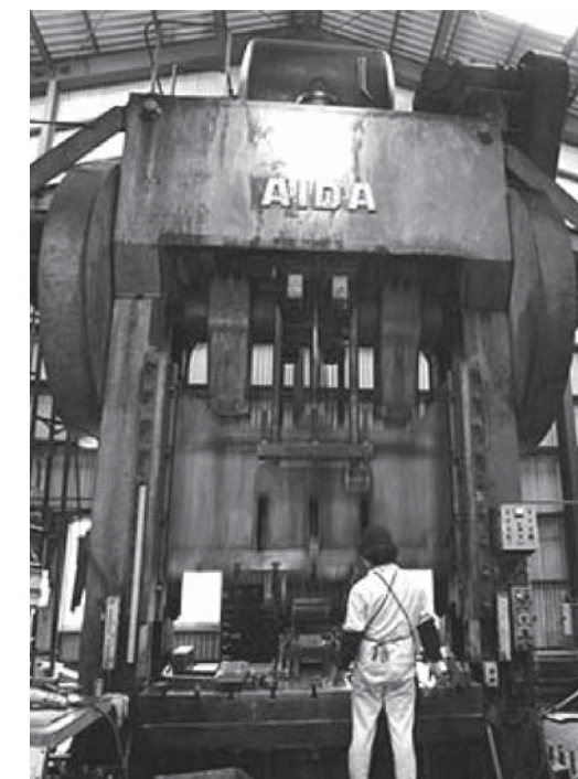
▲300tクランクプレス 大型プレス機は、高さ8m、奥行き1.5m、横幅3mの機械で300tクラスまでの製品製作が可能です。

これがあれば何万個でも同じ製品を、大量に作る事ができます。しかし、鉄の伸び、隙間などを考えて作らないと、作りたい製品とは少し変わることもあり、熟練の経験と勤が必要とされる、とてもやりがいのある仕事です。