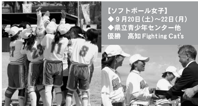
▲初優勝！キャプテンを胴上げ ▲市長から優勝メダル贈呈

9月19日(金)に開幕した日本スポーツマスターズ高知大会。今回で8回目を迎えたこの大会は、県内32会場にて13競技が行われました。香南市では「ソフトボール女子」が市内3会場で、「バスケットボール男子」が県立青少年センターで行われ、熱戦が繰り広げられました。※日本マスターズ出場資格…男子40歳以上、女子35歳以上