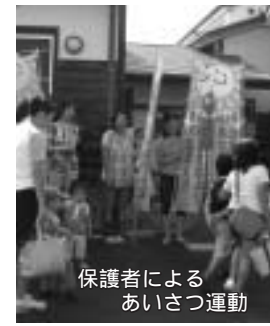
保護者によるあいさつ運動

長時間の保育で、送迎時に保護者同士が顔を合わせたり、ゆったり話をする機会が減ってきています。そこで、保育所と保護者会が協力し、毎月10日と20日に朝のあいさつ運動を実施しています。