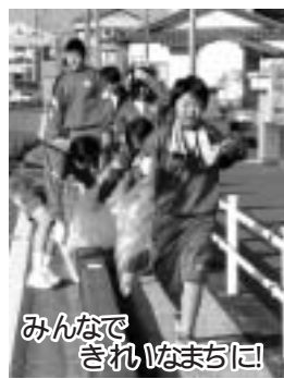
みんなできれいなまちに!

夏休みには、コンフレントライ(ニング)で職場体験学習として、2、3年生の生徒全員が、自分たちの希望する職場で体験学習を行っています。