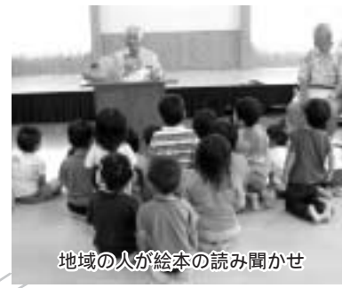
地域の人が絵本の読み聞かせ

絵本の読み聞かせをしていただいたり、七夕集会でいっしょに楽しんだり、年間を通じて地域の人と触れ合う時間を取り入れています。 地域の人の温かいまなざしに見守られ、優しさや感謝の気持ちを育てています。