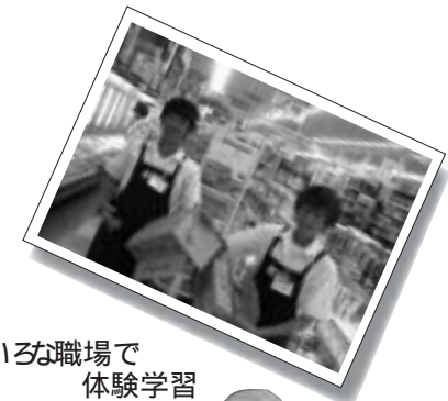
いろいろな職場で体験学習

昨年はロボコンコース選択学習の生徒たちが、鳥取県米子市で行われた中四国大会に出場しました。 今年は高知で行われ、生徒たちは全国大会をめざしてがんばっています。