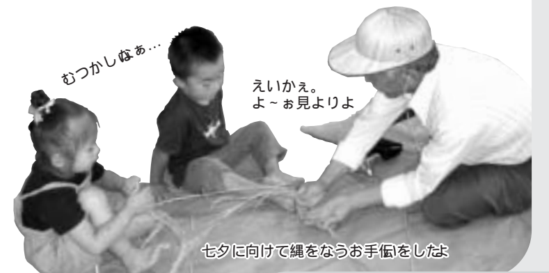
七夕に向けて縄をなうお手伝をしたよ

子どもたちは、幼稚園のお兄さん、お姉さん、小学生や中学生との交流活動を楽しみにしています。 優しく遊んでくれたり、いろいろな事を教えてくれたり、かっこいいところを見せてくれたり、あこがれの存在です。 年上の子どもたちとの交流活動を通じて、子どもたちはいろいろな刺激を受けます。