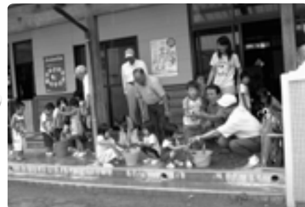
地域の人と水鉄砲作り

地域のいろいろな人に園に来ていただき、触れ合う時間を大切にしています。交流を通して、人とかかわりを深め、さまざまな体験のなかで、感謝の心や人に対する思いやりを育てていきます。