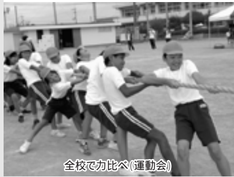
全校で力比べ(運動会)

本校の歴史は、明治21年に始まり、創立120年を迎えます。吉川町には、学校が一つだったこともあり地域の人の熱い思いやご協力を十分に受けて教育活動を推進してきました。近年児童数の減少傾向が見られ、本年度は69人となってしまいました。少人数ならではのきめ細かい支援を行っています。