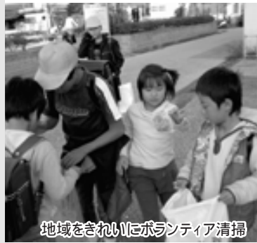
地域をきれいにボランティア清掃

少人数の吉川小学校では、69人みんながなかなよし。休み時間には、上級生・下級生の区別なく、サッカーや野球、一輪車の練習に励んでいます。また、清掃活動や運営委員会が計画するゲーム集会やボランティア清掃にも縦割り班で取り組みます。その中で、上級生がリーダーとしていろいろな力を身につけています。