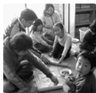
先輩の話を聞いて

給食参観日・試食会、親子歯磨き講習会、親子体操など参観日の在り方を考え、親子で楽しめる内容を工夫しています。