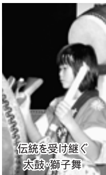
伝統を受け継ぐ太鼓の獅子舞

若竹子ども会では、小学校と中学生と一緒に太鼓・獅子舞を練習しています。太鼓・獅子舞を復興させた先輩たちの思いを受け継ぎ、力強く太鼓をたたきます。その響きは聞いてる人の心を打ちます。指導者は、高校生や若竹会青年部の人たち。優しく、時には厳しく指導をしてくださる。地域の行事などで発表するときは、細かいことまで面倒を見てくださっています。