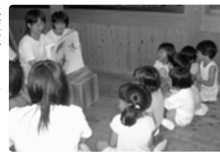
中学生が手作り紙芝居をしてくれたよ

年上の子どもたちとの交流活動を通して、園児が豊かに育つための、よい方法を考えられています。1日体験入学や保育実習など、お兄さんお姉さんがやさしく遊んでくれます。