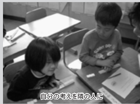
自分の考えを隣の人に