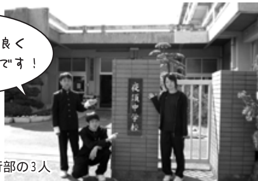
生徒会執行部の3人