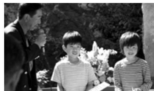
詩人「岡本弥太」をしのんで文芸賞が行われています。