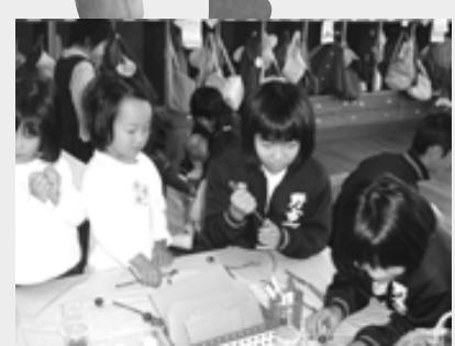
中学生が手作りおもちゃを持ってきてくれたよ

園のシンボルは、園庭の植樹104年を迎えたセンダンの大木。青葉が茂ると子どもたちが心地よい木陰に集まり、喜々として遊ぶ姿は昔も今も変わらない風景です。 このセンダンの幹には毎年5月になると、アオバズクがやって来ます。黄色いまん丸目玉を子どもたちに向け、まるで、健康やかな育ちを見守ってくれている「よつです」。