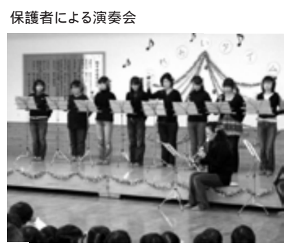
保護者による演奏会

保幼小中連携活動を 通して 子どもたちは多くの友達を大切にし、小中学校のお兄さんやお姉さんと遊ぶことによつてうれしさやあこがれ、そして思いやりの心を育んでいきます。隣の野市小学校児童が休み時間などに遊びに来てくれ、自然な交流の姿が見られます。