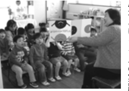
地域の人の絵本の読み聞かせ

心の通い合う人間関係を軸に、幼稚園・家庭・地域社会がそれぞれの力を発揮しながら、子どもの幸せを考えていくことが大切だと捉え、人と触れ合う時間を年間通じて取り入れています。