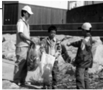
海岸清掃も協力して行いました

夜須町西町地区の「お町でござる」は、旧手結海水浴場を温かいまなざしで見つめて環境美化に努め、アサリの生態研究をしながら、潮干狩りのできる砂浜作りに取り組みました。