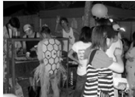
「妖怪祭り」と名付けた夏祭りで交流

行間団地と菖蒲谷団地が合同で、地域づくり活動を行いました。環境美化や夏祭り、昔遊びなど、子どもから高齢者までが一緒に活動し、自治会・地域づくりに取り組むことができました。