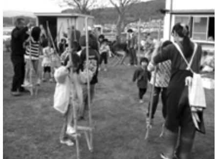
世代を超えた「昔遊び」で交流

地域内にある白岩荘広場に5,000個の水仙の球根を植える活動や、犯罪抑止効果を高めるため防犯灯を青色化する活動に取り組みました。また、世代間交流会を開催するなど自治会・地域づくりの活動を行いました。