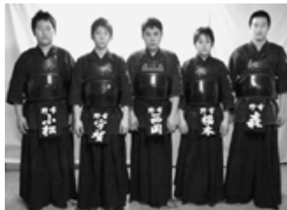
野市町スポーツ少年団剣道部のメンバー