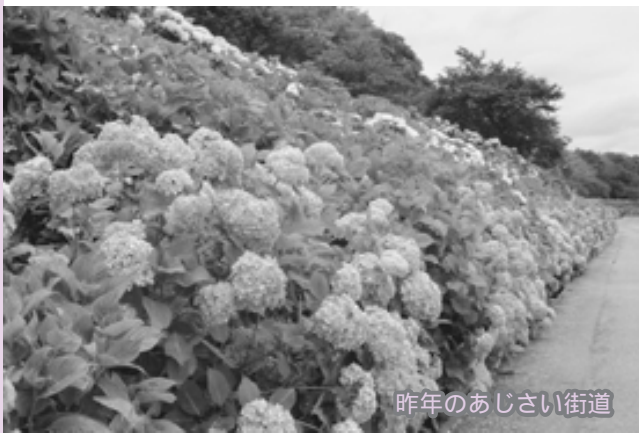
昨年のおじさい街道

も うすぐ見頃を迎える何万というアジサイたちは、仕掛け人二人の努力とそれを支えようとする地域を愛するの人たちの協力のたまもの。アジサイは花の時期が長く今年も七月上旬まで楽しめます。