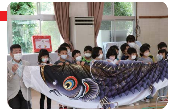
▲大きな鯉のぼりと一緒にハイチーズ♪

当日は屋内で寄贈式を行いました。子どもたちに鯉のぼりが手渡され、広げた状態で記念撮影。間近で見る鯉のぼりの大きさに、驚きの声が上がっていました。その後、園庭で鯉のぼりを大空へ泳がせました。子どもたちは、迫力のある大きな姿を嬉しそうに見上げていました。