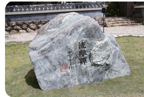
▲新たな観光スポットに!

香南市では、安岡家住宅の一般公開も行っているの、文学碑と同時に安岡家住宅の見学も行うことができます。