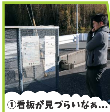
① 看板が見つらいなあ...