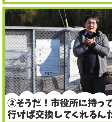
② そうだ！市役所に行って交換してくれるんだ！