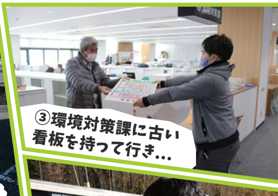
③ 環境対策課に古い看板を持って行き...