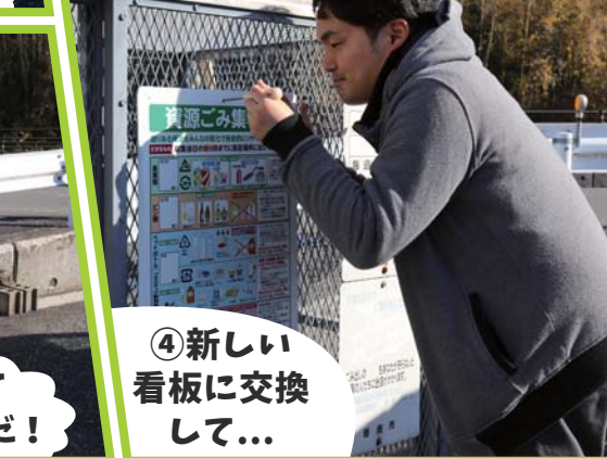
④ 新しい看板に交換して...