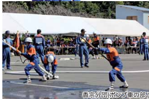
香宗分団(ポンプ車の部)