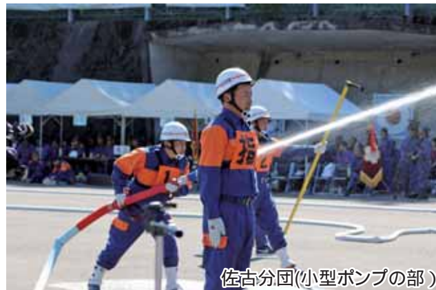
佐古分団(小型ポンプの部)