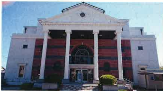
香南市野市図書館