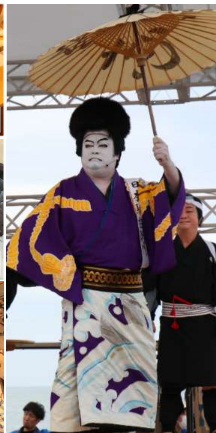
たいけん カブキ体験