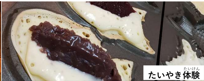
たいけん たいやき体験