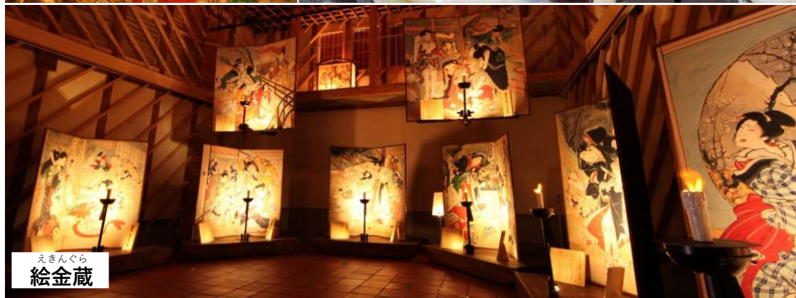
えきんぐら 絵金蔵