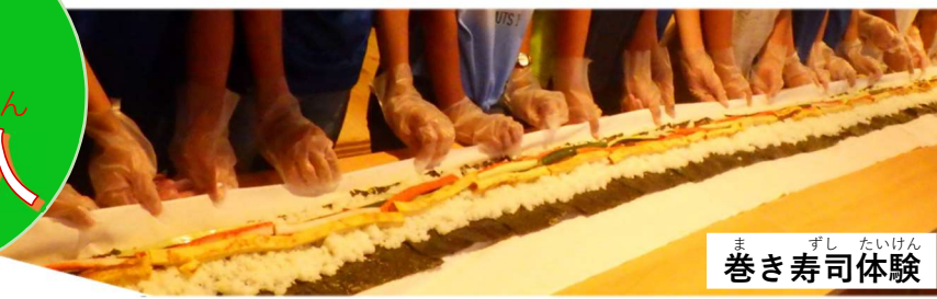
まきずし たいけん 巻き寿司体験