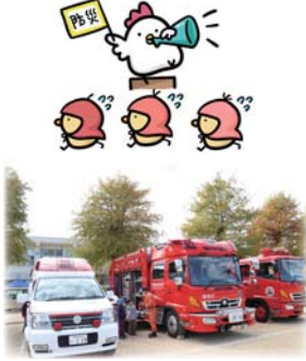
▲ 車両の展示・説明

企画ブースとして、会場中心には段ボール迷路も登場しました。災害時におけるダンボールの可能性は多様で、そのダンボールを使った迷路に訓練参加者も楽しみながら、ゴールを目指していました。天候にも恵まれ、身近に防災学習を深めることができた一日でした。