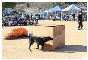
▲ 災害救助犬のデモンストレーション

企画ブースとして、会場中心には段ボール迷路も登場しました。災害時におけるダンボールの可能性は多様で、そのダンボールを使った迷路に訓練参加者も楽しみながら、ゴールを目指していました。天候にも恵まれ、身近に防災学習を深めることができた一日でした。