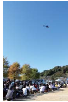
▲ 県警ヘリによる情報収集訓練

電力、LPガス協会やTOYOTAなどの関係機関による防災学習の各ブースを回り、デモ機にも触れながら防災・減災の学習をしていました。興味と関心を持って体験や質問する姿に、頼もしく感心させられました。