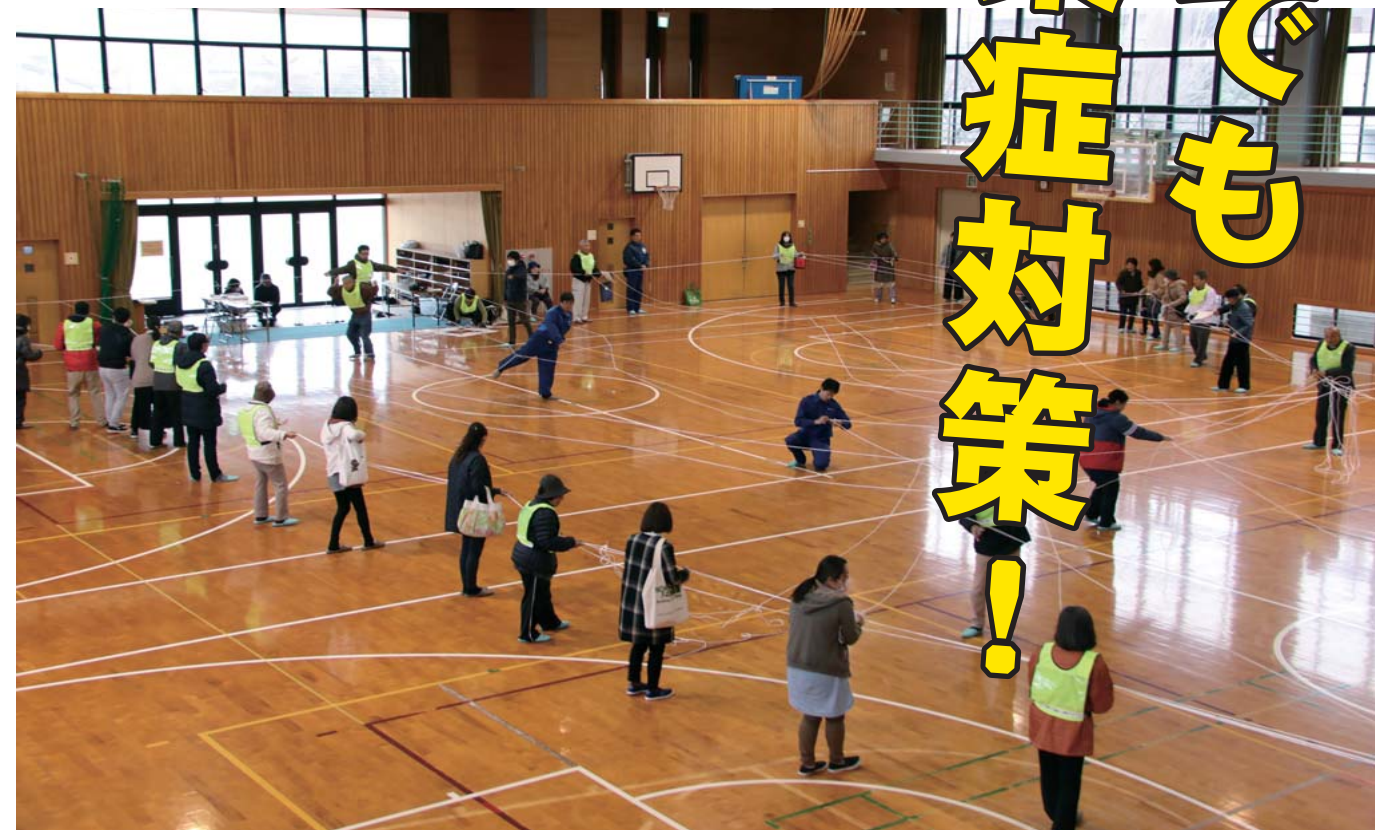
▲昨年の避難所運営訓練の様子