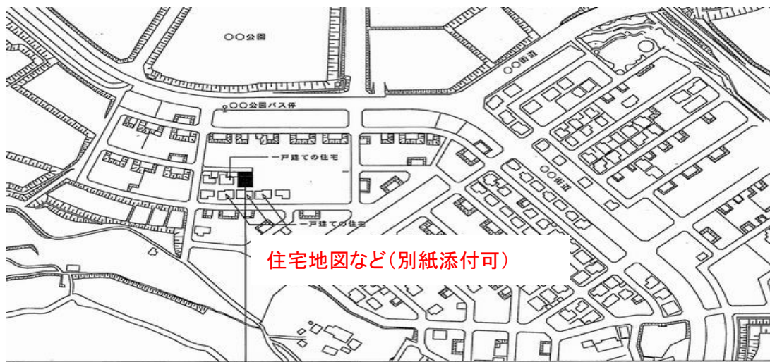
住宅位置図 (図面添付でも可)