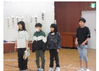
集会の進行をする運営委員会新メンバーと、アドバイスをする6年生です

春先は天気の変化が激しく、寒暖差も大きい季節です。締めくくりと次のステージに向けての春を元気に過ごせるよう、体調管理に気を付けて、毎日の学習や活動に元気に過ごしてほしいと思います。