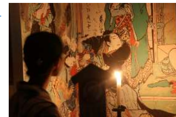
土佐赤岡絵金祭り