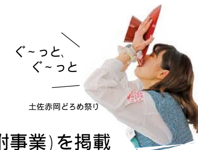
土佐赤岡どろめ祭り