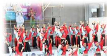
香南市みなこい港まつり