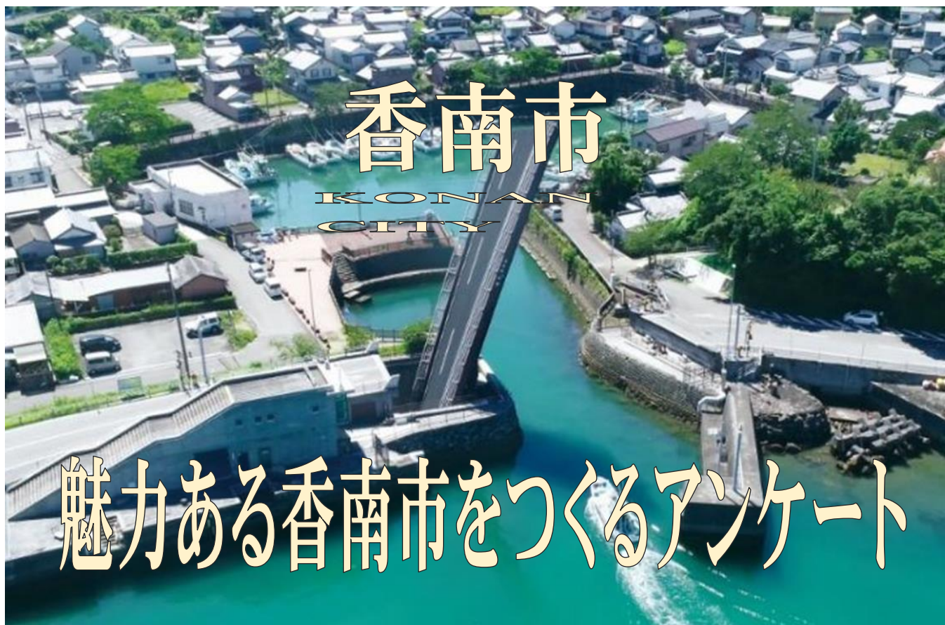
手結港可動橋（夜須町）