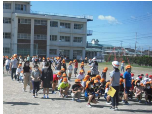
【〇年〇組全員避難確認しました】

「先生の指示に従って運動場に避難してください。」のアナウンスがあり、全校児童の避難が完了するのにかかった時間は、何と2分47秒でした。避難行動の仕方や態度もよく、話をしたりふざけたりする子どもはいませんでした。大きな揺れの地震を経験したことがない子どもがほとんどだと思います。いつか起こる南海トラフ地震に備えた実効性のある避難訓練や防災学習など、今後も継続していきたいと思います。