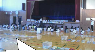
選書会:読みたい本がありすぎて、選ぶのに悩む姿が見られました。