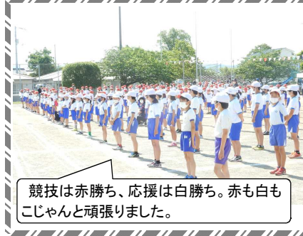
競技は赤勝ち、応援は白勝ち。赤も白もこじやんと頑張りました。