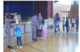
【ありがとうございました】

ししや天ぐの顔が近くにくるとこわかったけど、ししは面白かったです。ししの顔が重いので、おどっている人はつかれると思いました。神社でするために、いっぱい練習していることが分かりました。11月1日にも見に行きたいです。