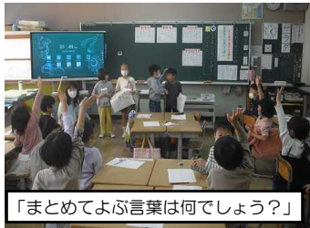
「まとめてよぶ言葉は何でしょう？」

10月26日(水)の5校時に、1年1組(Mori学級)で国語科の研究授業を行いました。講師として森指導主事(東部教育事務所)をお招きし、全教員が見守るなか、1年1組児童が、いつも通り元気に授業をしました。「まとめてよぶことば(例：どうぶつ)」を自分で決め、「なかまになることば(例：犬、ネコなど)」を考えました。何個考えるかは、自分で目標を決めていました。目標数を達成するために、じっくりと考える子どもたちの姿が見られました。