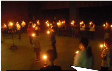
全員元気に宿泊学習【11/29-30 青少年センター】に行ってきました！【5年生】