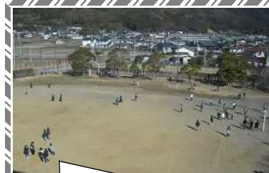
寒さに負けず、元気に外遊びをしています