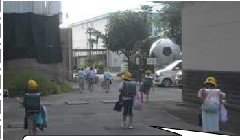
さあ、学校や！宿題いっぱい持って来たで。みんなの作品も見たいなあ。