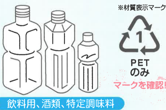
飲料用、酒類、特定調味料