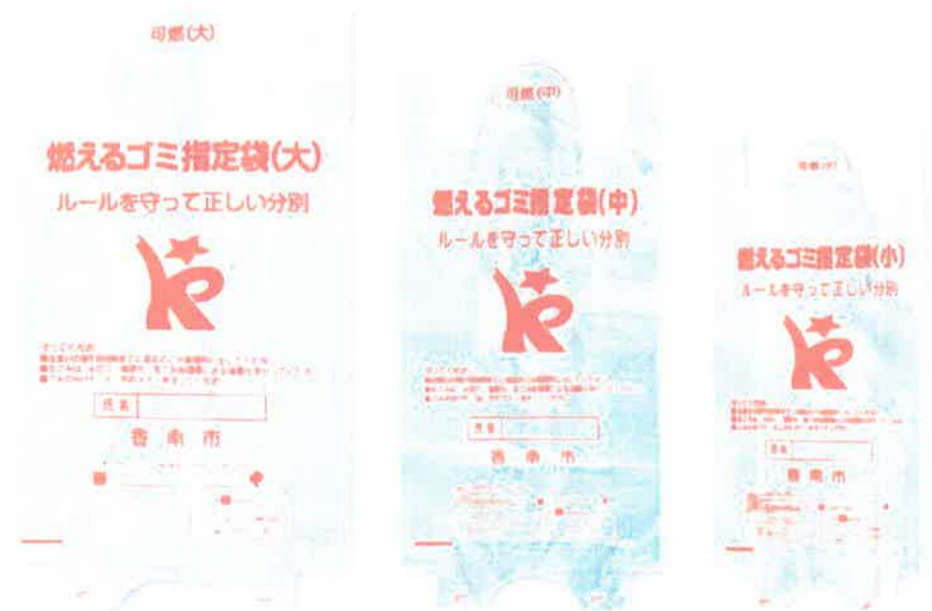
燃えるごみ指定袋(白色)